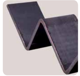
1 Estación permanente de plegado conforme a la normativa CE.